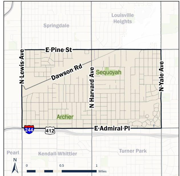
Sequoyah (Tractos del Censo: 14, 15)

El área estadística del vecindario Sequoyah cubre 2.3 millas cuadradas entre las calles Admiral Place, Pine Street, Lewis Avenue y Harvard Avenue. El área se compone de una mezcla de viviendas unifamiliares, algunas viviendas con múltiples unidades, industria moderada y comercios minoristas ubicados sobre las intersecciones de calles o arterias principales. El área es el hogar del Parque Sequoyah, el Parque Archer, cuatro escuelas públicas, el Mabee Boys & Girls Club, el cementerio de Rose Hill y un segmento del alineamiento histórico de la Ruta 66 a lo largo de Admiral Place.